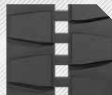
ŤAŽKÁ PREVÁDZKA, HLADKÝ DEŽEN