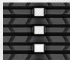
ŤAŽKÁ PREVÁDZKA, HRUBÝ DEŽEN