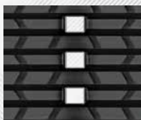
ŤAŽKÁ PREVÁDZKA, HRUBÝ DEZÉN